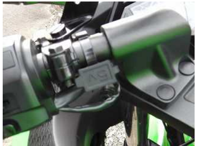
KIJIMA製メットホルダー